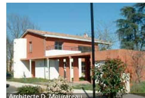
Architecte D. Mourareau