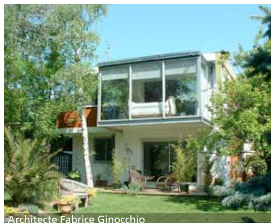
Architecte Fabrice Ginocchio