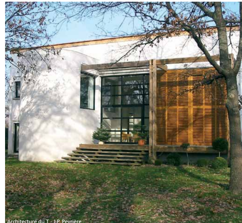
Architecture du T - J.P. Peyrière

Enfin, il simplifie les démarches administratives en traduisant dans le projet de maison les règles d'urbanisme et de construction.